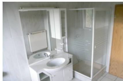
Teilansicht des Badezimmers